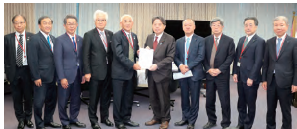
林総務大臣への要望

具体的には、米国の関税政策により影響を受ける事業者への支援といった直近の課題から、イノベーション創出に向けた研究開発支援、GX政策の戦略的な見直し、山陰道や下関北九州道路といった高規格道路の早期整備など、中長期的な観点からの継続要望まで、幅広いテーマを取り上げています。