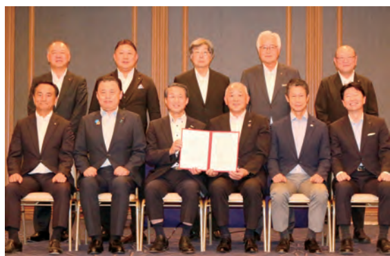
中国地域広域リージョン連携宣言：2025.9

携プラットフォーム」を立ち上げ、広域リージョン連携宣言を行いました。今年5月には広域リージョン連携ビジョンも公表し、まずは観光振興や地域企業のDX支援など、産業振興の分野から先行して取組みを進めていくこととしています。