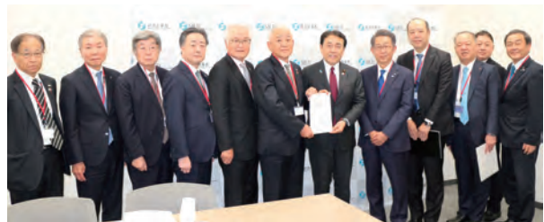
赤澤経産大臣への要望

そうした提言・要望を、より現場の実情に即したものにするため、日頃どのように地域や会員企業の声を取り取っておられるか、ご紹介いただけますでしょうか。