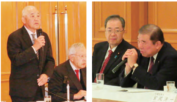
地元国会議員との懇談

要望内容は、「地域産業の競争力強化」「カーボンニュートラルの推進」「観光の振興」「地域