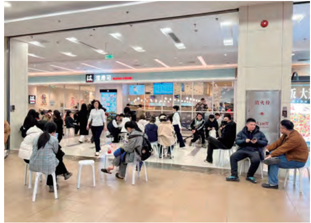
回転寿司店で入店を待つ人々

建築資材や造船部品の製造委託先は、中国国際貿易促進委員会や大連市中日経済合作交流協会に依頼し紹介してもらいました。図面等を提